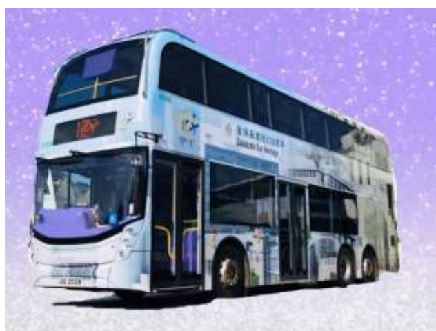
紀念巴士參考圖片

為慶祝聖保羅書院創校 170 年及配合校慶音樂會，本會將與聖保羅書院家長教師會於 2021 年 10 月 31 日（星期日）舉辦乘坐 170 周年校慶紀念巴士的活動，路線由中環至尖沙咀， 所有收益扣除成本將撥捐聖保羅基金會 。活動詳情如下：